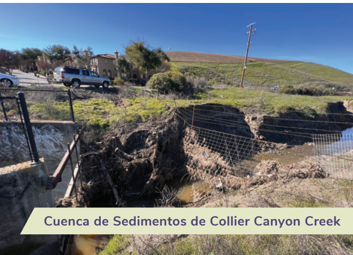
Cuenca de Sedimentos de Collier Canyon Creek