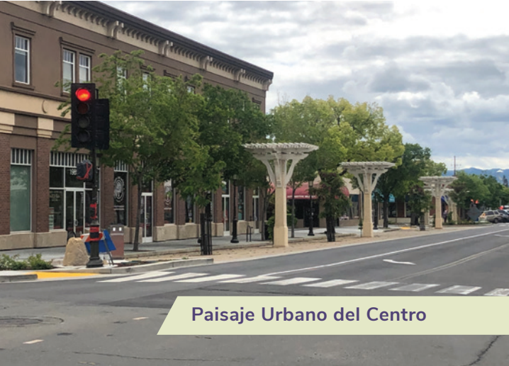
Paisaje Urbano del Centro