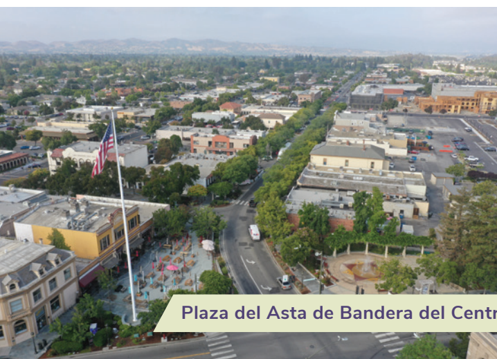
Plaza del Asta de Bandera del Centro

¿Sabía que una parte de sus impuestos regresa a la Ciudad para ayudar a planificar, construir y mantener nuestra infraestructura de transporte? La ciudad de Livermore tiene 688 millas de carriles de calles, 40 millas de senderos para bicicletas y peatones, 69 millas de carriles para bicicletas, más de 100 semáforos y aproximadamente 8,000 farolas.