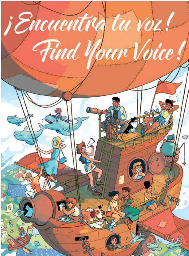
Tema del Verano 2023: "Encuentra Tu Voz"