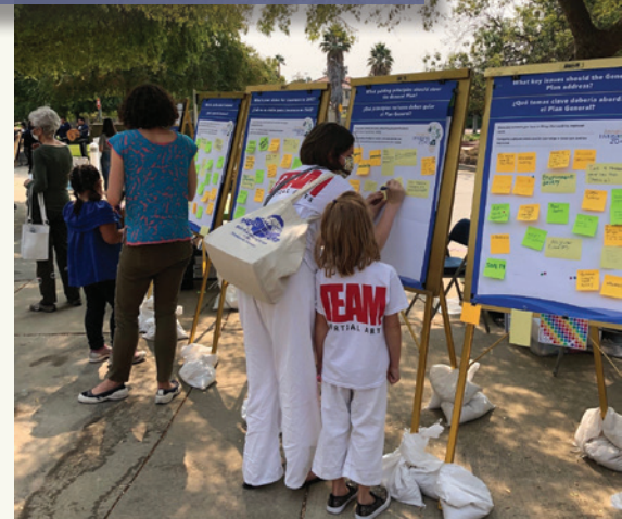
Los residentes escriben sus ideas y su visión para el futuro de Livermore