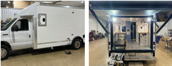
El nuevo camión CCTV híbrido de Livermore

Para servir mejor a nuestra comunidad, la Ciudad de Livermore recientemente actualizó su camión de CCTV. Este nuevo vehículo híbrido está equipado con capacidades de video digital HD 360 y software que incorpora tecnología de mapeo de sistemas de información geográfica (GIS). Al realizar más inspecciones y mantenimiento preventivo, la Ciudad continuará brindando un servicio de alcantarillado de calidad. Después de todo, una onza de prevención vale una libra de cura.